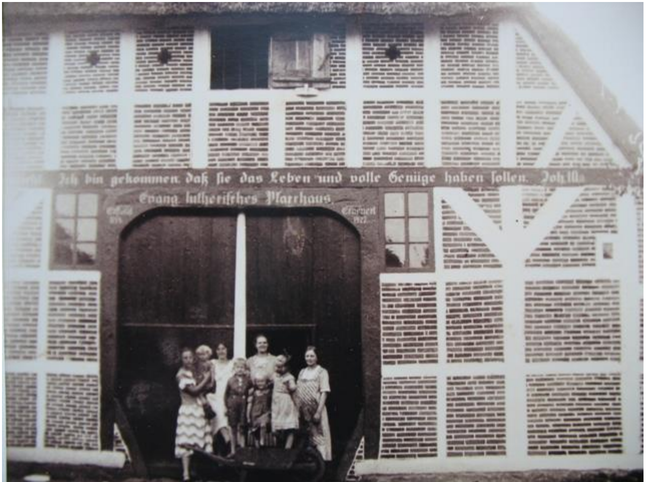
Nordseite des Pfarrhauses mit dem großen Dielentor

Auf der Diele, mit Zementfußboden, wurde gegessen und auf dem Boden darüber, dem eigentlichen Kornboden, war Stroh ausgeschüttet zum Schlafen. Wie man hinaufkam, weiß ich nicht. Ich vermute über eine „Hühnerleiter“, wie in den Bauernhäusern üblich. Gewaschen haben sie sich wahrscheinlich auf der Diele oder draußen, in Emaille-Waschschüsseln, zu denen das Wasser aus der Pumpe in der Waschküche geholt werden musste. Im Pfarrhaus gab es sicherlich nur ein Plumpsklo. Es war alles sehr primitiv, aber die Hamburger – und auch andere Gäste – waren begeistert. Dann gab es noch ein „Propheten-Stübchen“ irgendwo oben.