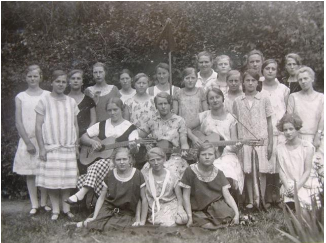
Jungmädchenverein, 20ziger Jahre – in der hinteren Reihe (mit Wimpel)

Die Besuchergruppen (DCSV, CVJM, CP (=Christliche Pfandfinder), u.ä.), die nach Elstorf fuhren, stammten zum großen Teil aus Hamburg. Es kamen immer mehr Gruppen. Bei ihren Eintragungen fällt auf, wie glücklich die Hamburger waren aufs Land, in die Natur zu kommen.