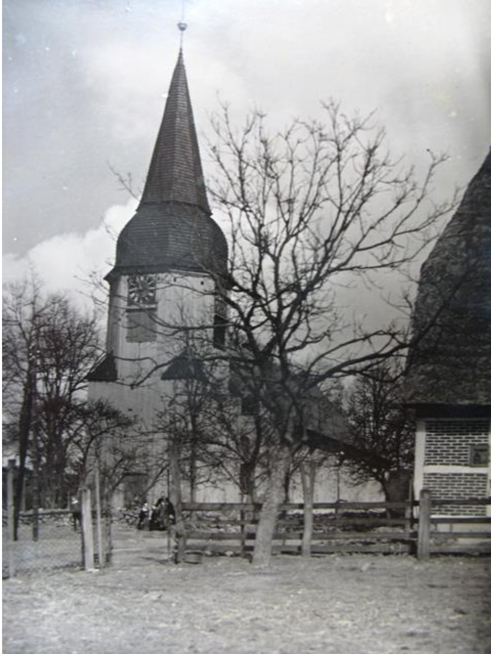
Nicolai-Kirche, 1.Mai 1929

In den ersten Eintragungen wird deutlich, dass G a s t f r e u n d s c h a f t für meine Eltern sehr wichtig war. Sie haben ihren Trauspruch „Ich aber und mein Haus wollen dem Herrn dienen“ bewusst gelebt. Mit ihrer Person, ihrem Haus und allem, was dazu gehört. Sie haben unendlich viele Menschen, Freunde und Fremde, an ihrem Leben teilnehmen lassen und dadurch vielen wichtige Anstöße gegeben.